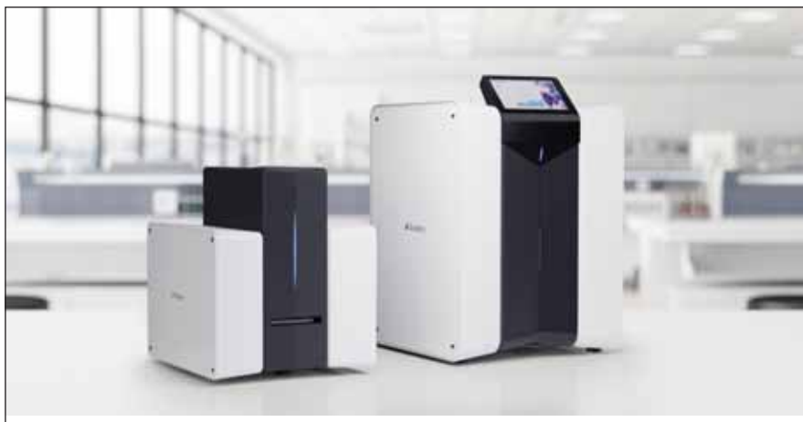
Obr. 2. Dvě kapacitní varianty zařízení Scpio.