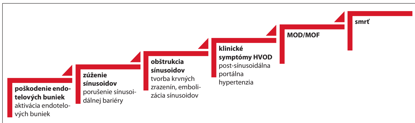
Obr. 1. Patofyziologický proces HVOD.