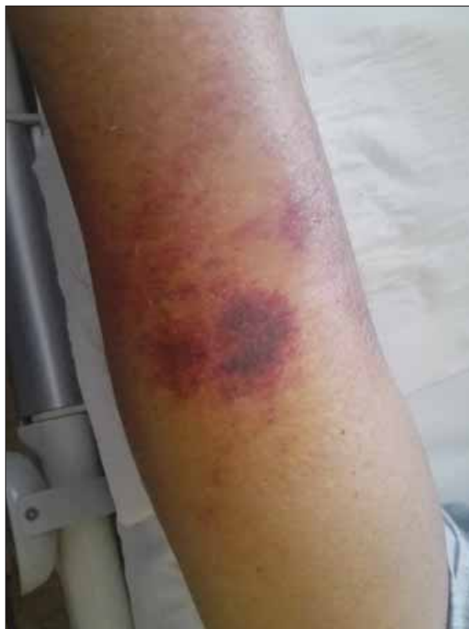
Obr. 4. Kožní forma mukormykózy – dorzální strana předloktí levé horní končetiny.