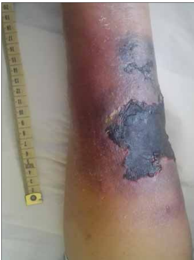
Obr. 3. Kožní forma mukormykózy – volární strana předloktí levé horní končetiny.