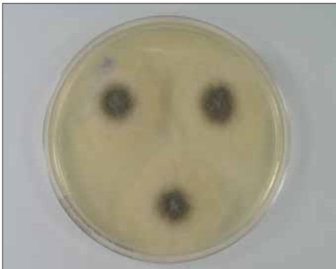
Obr. 1. Kultura Mucor sp. na Sabouraudově agaru.