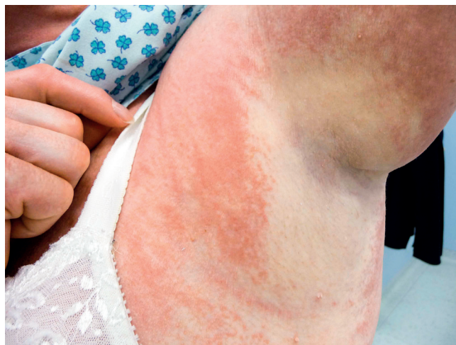
Obr. 2 Mramorovaná kůže pacientky se skleromyxedémem: místy bledá, místy lividní