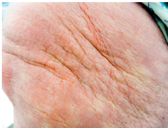
Obr. 3 Struktura ztlustělé kůže pacientky se skleromyxedémem

Histopatologické vyšetření válečku kostní dřeně prokázalo 2–4 % klonálních plazmocytů. Monoklonální imunoglobulin IgG kappa vstupně dosahoval koncentrace 9,0 g/l. Literatura popisuje souvislost skleromyxedému s Mlg, proto byla indikována léčba vedoucí k potlačení tvorby Mlg, i když diagnóza odpovídala monoklonální gamapatii nejasného významu (MGUS). Byla zvolena terapie pomocí kombinace cyklofosfamidů, bortezomibu a dexametazonu. Ta dosáhla poklesu Mlg z 9,0 g/l na 3,9 g/l. V průběhu léčby se dočasně zmenšily i kožní projevy. Pacientka uvedla, že pociťovala částečné změknutí kůže a podkoží, ale změny na kůži odpovídající skleromyxedému byly stále patrné. V roce 2010 proběhlo poslední kontrolní histopatologické vyšetření kůže. Patolog popsal rozšíření dermis