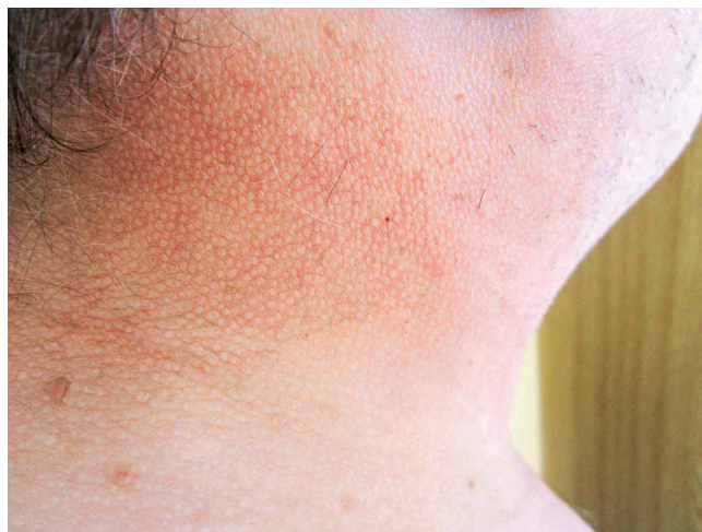
Obr. 6 Kůže v oblasti krku u pacienta se skleredémem

stolice maximálně 1× týdně. Byla provedena biopsie a histologické hodnocení kůže a podkoží. Jak histologický nález zmnoženého mucinu v celé retikulární dermis , tak klinický nález odpovídaly diagnóze skleredém ( skleroedema adultorum Buschke ). Vzhledem k současnému průkazu nálezů Mlg typu IgG kappa byl pacient dále směřován na hematologii. Histopatologické vyšetření válečku kostní dřene prokázalo 5 % klonálních plazmocytů. Zobrazovací vyšetření neprokázalo žádné postižení skeletu, diagnostická kritéria pro mnohočetný myelom nebyla naplněna.