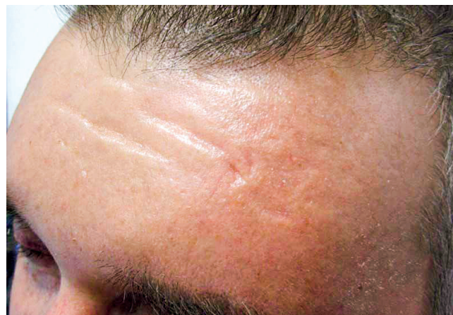
Obr. 4 Čelo pacienta se skleredémem

200 mg/m 2 s následnou transplantací autologních periferních buněk). Kompletní remise trvala 5 let, v roce 2017 začal recidivovat jak myelom, tak i kožní projevy. Pacient odmítl další léčbu a v září 2018 zemřel. Uvedený případ dokumentuje, že léčba (klasická chemoterapie zakončená vysokodávkovanou chemoterapií) vedoucí k úplnému vymizení Mlg vedla i k úplnému a dlouhodobému vymizení kožních i mimokožních projevů skleredému, jak dokumentují obrázky 4 a 5.