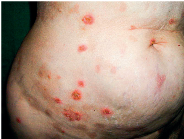
Obr. 7 Kožní puchýřnaté onemocnění IgA pemfigus u pacientky s mnohočetným myelomem

(kombinace bortezomib, cyklofosfamid, dexametazon) dovedla pacientku do kompletní remise mnohočetného myelomu, došlo k vymizení Mlg. Paralelně s vymizením Mlg vymizely i kožní morfy pemfigu. Kompletní remise trvala 3 roky a po tuto dobu byla pacientka bez kožních morf. Recidiva nemoci byla spojená s obnovením kožních morf, čím vyšší koncentrace Mlg typu IgA, tím více kožních morf. Léčba recidivy byla neúspěšná a pacientka nemoci nakonec podlehla. Tento případ demonstruje možnost, že Mlg může být také etiologickou příčinou pemfigu. Kožní změny dokumentují obrázky 7 a 8.