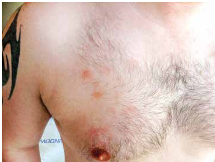
Obr. 3. Detail kožní léze na trupu, stav po zahájení předfáze kortikosteroidy

přípravném režimu s redukovanou intenzitou (RIC) Flu + Mel + TG (fludarabin 150 mg/m 2 , melfalan 140 mg/m 2 , thymoglobulin 4,0 mg/kg), byl 23. 7. 2015 proveden převod štěpu s obsahem 4,29 x 10 6 /kg CD34+ a 2,65 x 10 8 /kg jaderných buněk. Komplikací v potransplantačním období byl rozvoj klostridiové enteritidy (pozitivní klostridiový toxin i antigen) s promptním ústupem potíží na terapii metronidazolem per os. Další průběh hospitalizace byl již bez potíží. Nemocný byl propuštěn v den +25 po transplantaci ve stabilizovaném stavu do ambulantní péče. Prevence GVHD ( graft-versus-host disease ) byla zajištěna kombinací cyklosporinu A (CyA) a mykofenolát mofetilu (MMF). Aplikace CyA byla zahájena v den -1 před transplantací v dávce 6 mg/kg denně a následně korigována, s cílem udržet v časném potransplantačním období hladinu 200–300 ng/ml. Při absenci jakýchkoliv známek GVHD byla redukce CyA zahájena v den +56 s cílem pozvolného vysazení do dne +110 až 130 po TKB při remisi základního onemocnění a 100% dárcovském buněčném chimérismu. Podávání MMF bylo zahájeno v den +1 v dávce 30 mg/kg/den, s redukcí a postupným vysazením mezi dny +29 a +56.