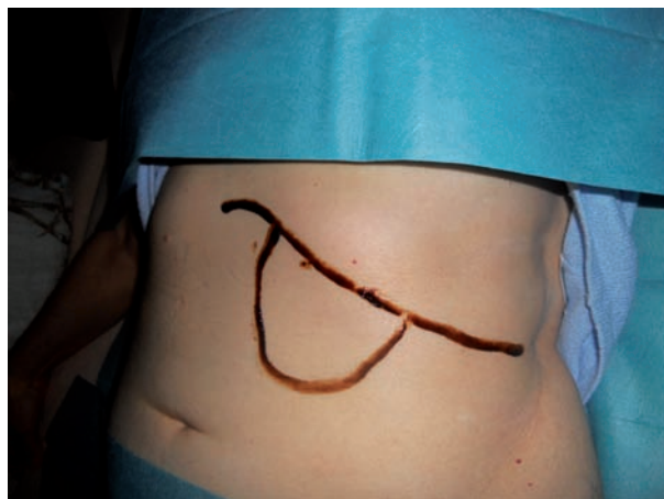
Obr. 2. Velikost sleziny po roce užívání megestrolu u pacientky č. 2.