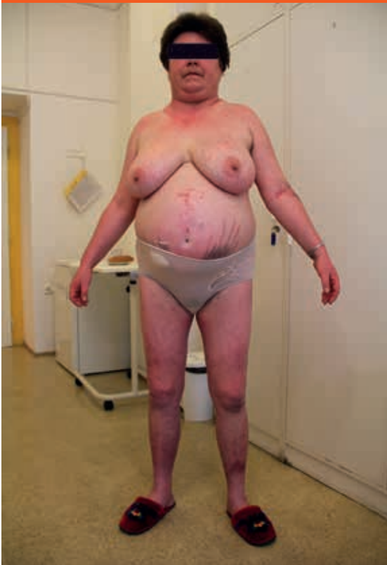
Obr. Habitus pacientky s Cushingovým syndromem.

Hlavním patogenetickým faktorem poruch metabolismu glukózy u CS jsou zvýšené cirkulující koncentrace kortizolu, které interferují s glukózovým metabolismem na řadě úrovní. Pankreatické beta-buňky na svém povrchu exprimují glukokortikoidní receptory a bylo prokázáno, že glukokortikoidy vedou k jejich dysfunkci. Konkrétně dochází k alteraci vychytávání glukózy beta-buňkami a k poruše metabolismu glukózy v nich a následně k poruše exocytóze sekrečních granul obsahujících inzulin [14]. Krátkodobé podávání glukokortikoidů vede rovněž ke snížení inzulinotropního účinku GLP1 (glucagon-like peptide 1) [15]. Hlavním mechanismem rozvoje glukózové intolerance a DM u CS je glukokortikoidy indukovaná inzulinová rezistence periferních tkání, zejména pak v játrech, přičně pruhované svalové a tukové tkáni. Ve svalové a tukové tkáni kortizol vede postreceptorovým mechanismem k alteraci všech účinků inzulinu. V játrech dochází účinkem glukokortikoidů ke zvýšení glukoneogeneze a glykogenolýzy, ve svalové a tukové tkáni dochází ke snížení vychytávání a metabolismu glukózy, v tukové tkáni dochází navíc ke zvýšení lipolýzy a uvolňování volných mastných kyselin do oběhu [16]. Kromě uvedených účinků kortizol moduluje expresi a aktivitu některých adipokinů, např. adiponektinu, leptinu, rezistinu a apelinu, a prostřednictvím nich rovněž ovlivňuje inzulinovou senzitivitu. Shrnutí základních patofyziologických mechanismů poruchy glukózo-