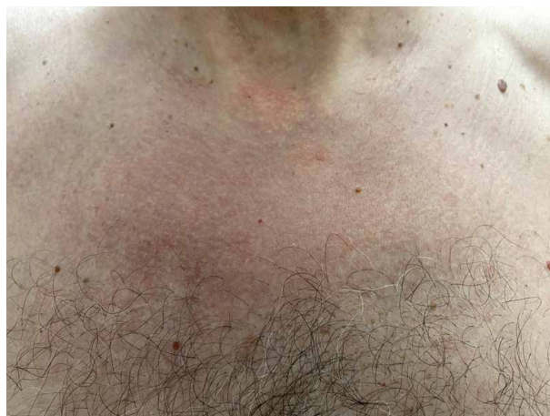
Obr. 6. Plošný erytém u pacienta se syndromem VEXAS

U pacientů jsou relativně časté vaskulitidy (dle některých autorů stejně časté jako neutrofilní dermatózy [17]), postiženy mohou být cévy jakéhokoliv kalibru. Mohou klinicky imponovat jako polyarteritis nodosa nebo kožní vaskulitida [17]. Nejčastější je leukocytoklastická vaskulitida, nicméně dle některých prací mají kožní léze v histologickém obraze vysoký stupeň leukocytoklasie, bez přítomnosti fibrinoidní nekrózy, a nespĺňují tedy kritéria pro diagnózu leukocytoklastické vaskulitidy [18]. Tato „perivaskulární dermatitida“ se klinicky projevuje purpurou a bývá též častým projevem syndromu VEXAS [17]. Postižení pojivové tkáně zahrnuje artralgie nebo artritidy a chondritidy (obr. 7).