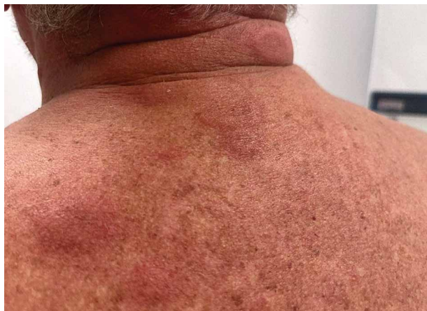
Obr. 2. Neutrofilní dermatóza u pacienta se syndromem VEXAS

Kožní projevy jsou nejčastější orgánově specifickou manifestací syndromu VEXAS, vyskytující se u 88 % pacientů. V 63 % případů je kožní postižení prvním příznakem onemocnění [15]. Závažnost a charakter kožních projevů se mění v čase s obdobími relapsů a remisí [18]. Typická je rovněž velmi dobrá reakce kožních projevů na systémové glukokortikoidy [15]. Nejčastější kožní manifestací jsou mnohočetná, erytematózní, edematózní ložiska připomínající Sweetův syndrom (Sweet syndrome-like), s maximem na trupu a končetinách (obr. 2) [3, 18].