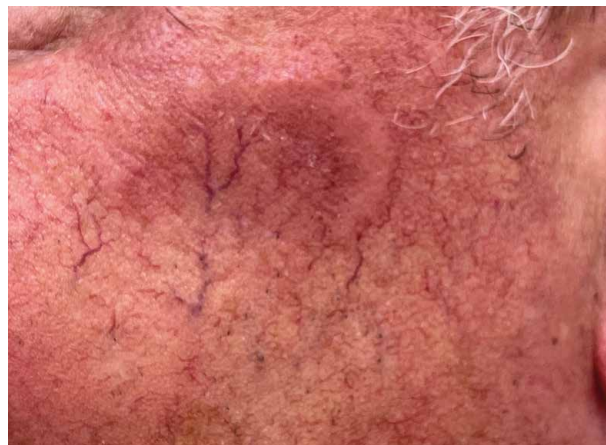
Obr. 3. Charakteristické semilunární kožní projevy u pacienta se syndromem VEXAS

Asi u třetiny pacientů mají tyto projevy semilunární tvar (obr. 3). K dalším kožním projevům patří podkožní noduly podobné jako u erythema nodosum anebo hmatná purpura způsobená vaskulitidou. V histopatologickém vyšetření projevů připomínajících akutní neutrofilní dermatózu (Sweetův syndrom) v kožní biopsii typicky nacházíme obraz neutrofilní dermatózy s infiltráty z nevyzrálých myeloidních buněk, různým podílem neutrofilů s menším podílem lymfocytů [18,19]. Tyto většinou perivaskulární neutrofilní infiltráty leukocytoklasii a s intersticiálním edémem typicky postihují celou dermis,