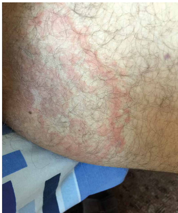
Obr. 5. Mapovitý erytém u pacienta se syndromem VEXAS

vzácněji zasahují až do hypodermis. Diferenciálně diagnosticky může pomoci skutečnost, že léze u syndromu VEXAS obvykle nejsou bolestivé, i když vzácněji se vyskytla jak bolestivost, tak svědivost [18].