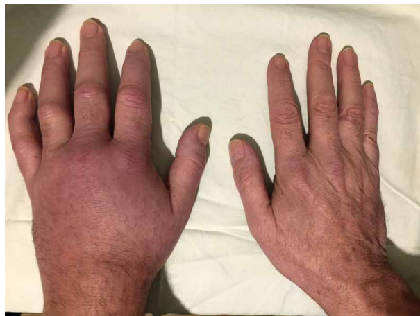
Obr. 7. Artritida u pacienta se syndromem VEXAS