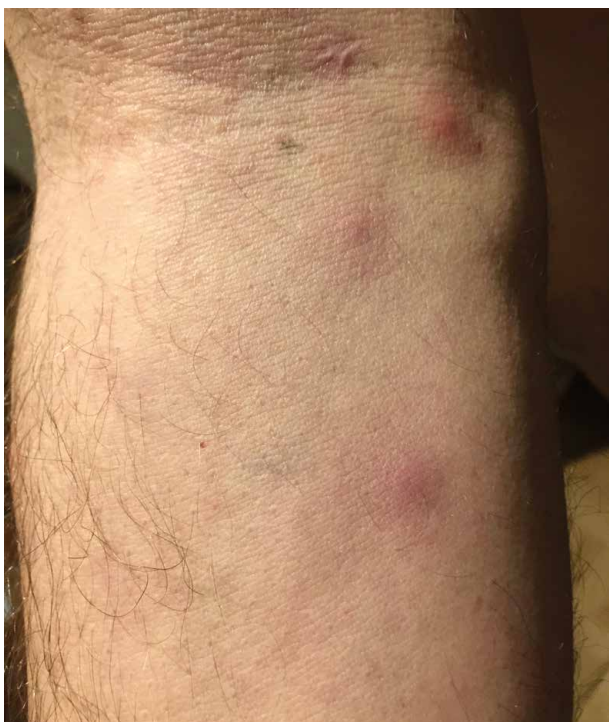
Obr. 4. Makulopapulózní exantém u pacienta se syndromem VEXAS