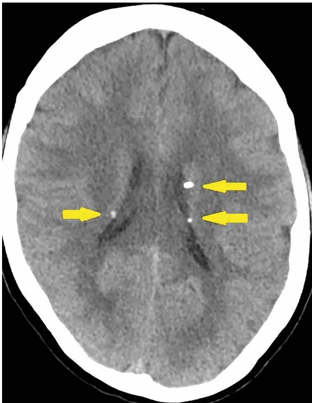
Obr. 7. CT mozku – drobné kalcifikace subependymálně v postranních komorách