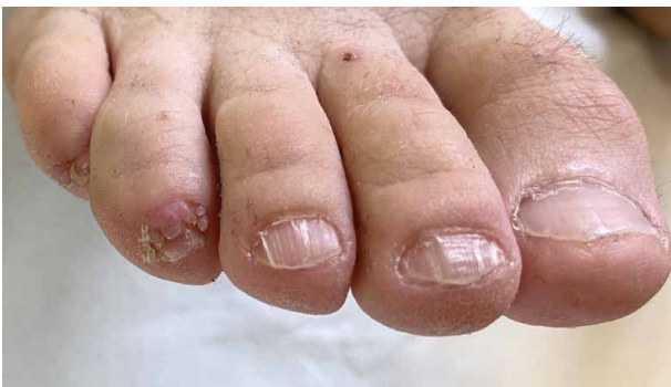
Obr. 3. Stroužkovité útvary periunguálně na IV. a V. prstu pravé nohy