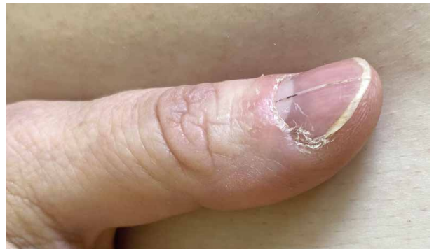
Obr. 4 a 5. Nehtová dystrofie na prstech ruky