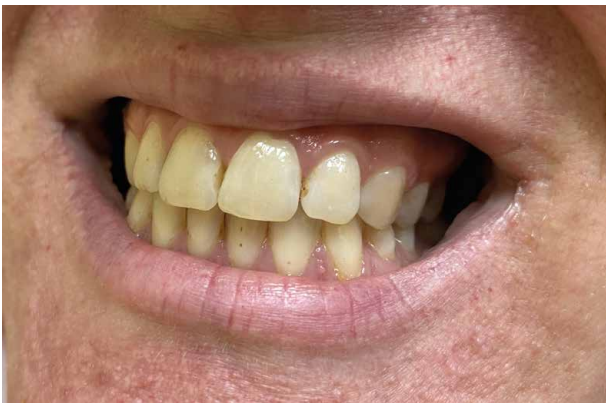
Obr. 2. Jamky v zubní sklovině a drobné hyperplazie dásní