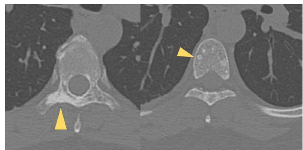
Obr. 9. CT hrudní páteře – sklerotická ložiska skeletu páteře

Pacientka zůstává i nadále v péči uvedených odborností: dermatologie, oftalmologie, stomatologie, neurologie, plicní, nefrologie a psychiatrie. Genetické vyšetření syna pacientky bylo negativní, mutace genu TSC1 u něj nebyla prokázána. Další potomky pacientka nemá. Bratr ani rodiče pacientky nebyli vyšetřeni.