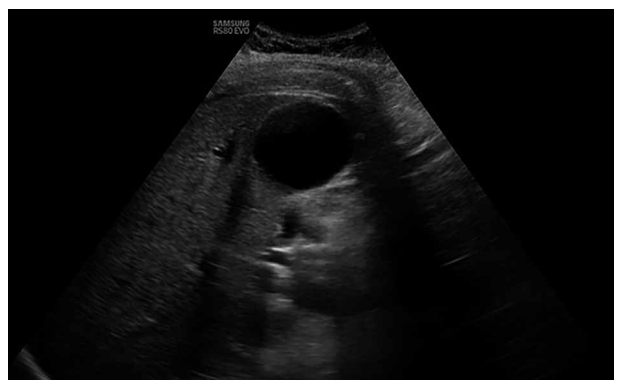
Obr. 6. Korová cysta pravé ledviny na ultrazvukovém vyšetření

Pacientka byla odeslána ke genetické konzultaci, která se realizovala s více než tříměsíčním odstupem. V mezidobí proběhlo oční vyšetření, RTG hrudníku a echokardiografie s normálním nálezem. Ultrazvuk břicha odhalil korovou cystu pravé ledviny, jaterní steatózu a žlučové bláto (obr. 6). V lednu 2023 podstoupila vyšetření na urgentním příjmu nemocnice pro nauzeu, slabost a následný kolaps. Na CT mozku byly patrné drobné nodulární kalcifikace subependymálně