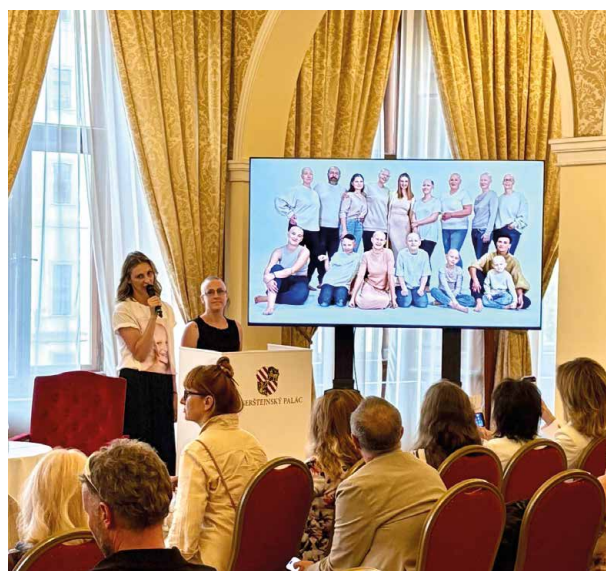
Kolibřící pomáhají – alopecia areata