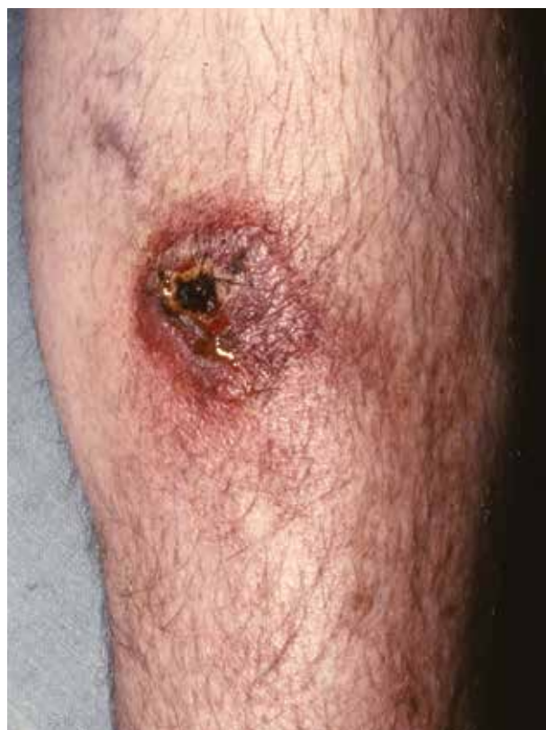
Obr. 4. Ecthyma gangrenosum, ostře ohraničený nekrotický defekt s hemoragickou krustou a okolní jemnou purpurou

Tyto syndromy sdílejí rysy invaze různorodých organismů v cévní stěně. Obvykle se vyskytují u těžce imunokompromitovaných pacientů s těžkou neutropenií a/nebo lékově navozenou imunosupresí. Ecthyma gangrenosum je syndrom okluze organismy (obvykle bakteriálními) proliferujícími v adventicii podkožních cév. Typickou bakterií je Pseudomonas aeruginosa , ale kožní léze podobné ecthyma gangrenosum byly popsány i u jiných bakterií, včetně jiných Pseudomonas spp. ( P. cepacia , P. maltophilia ), Serratia marcescens , Aeromonas hydrophila , Klebsiella pneumoniae , Vibrio vulnificus , Moraxella spp. , Morganella morganii , Escherichia coli a Staphylococcus aureus . Ecthyma gangrenosum mohou vyvolávat i houbové infekce, např. Candida albicans , Mucor spp. , Aspergillus fumigatus , Fusarium spp. a Neoscytalidium dimidiatum [43]. Ecthyma gangrenosum začíná jako erytematózní, nebolestivá makula, typicky progredující do purpury nebo escharotických a nekrotických lézí (obr. 4), které mohou být bulózní nebo pustulózní a často vykazují retiformní rysy. Dochází k rozsáhlé bakteriální infiltraci tunica media, následně i adventicie a perivaskulárního prostoru okolí cévy. Výsledným procesem je stlačení cévní stěny se zúžením lumen přívodné dermální či subkutánní arterioly. Okamžitá antibiotická terapie je zásadní, ale většinou