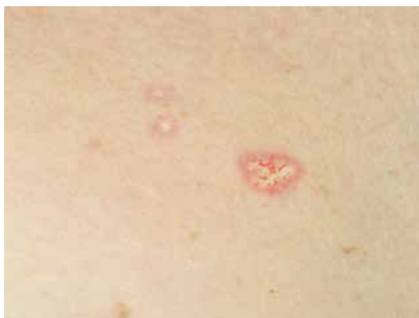
Obr. 7. Maligní atrofická papulóza, erytemová papula s centrální bílou atrofií charakteru atrofie blanche

Tento syndrom progresivní ischemické obliterující vaskulopatie doprovází pacienty s pokročilým renálním selháním, byl ale popsán i u pacientů bez zásadního renálního postižení [55]. Známé rizikové faktory pro rozvoj kalcifylaxe zahrnují konečné stadium onemocnění ledvin, hemodialýzu, obezitu, diabetes mellitus, častější postižení žen nebo užívání warfarinu a onemocnění jater. Mezi další rizikové faktory patří hyperparatyreóza, suplementace vápníku a příjem vitamínu D [32]. Kalcifylaxe je charakterizována intimální fibrózou a vaskulární kalcifikací tunica media (která se může stát transmurální). Aby došlo ke kalcifikaci cév, důležitým krokem je přeměna buněk hladkého svalstva cév na buňky podobné osteoblastům. Jako potenciální stimuly pro tuto přeměnu jsou zvažovány cirkulující fosfáty, zánětlivé mediátory v cévní stěně a kostní morfogenní protein (BMP)-2. K samotné obliteraci dochází pozvolna, při progresi cévního postižení kalcifikací a sekundárně vzniklou trombózou. Postižení kůže je dominantně v oblastech bohatých na podkožní tuk, jako jsou stehna, hýždě a břicho. Časně léze se obvykle projevují jako špatně ohraničené, někdy symetrické, velmi bolestivé erytemové makuly, nebo jako retiformní purpura či livedo racemosum . Následně se mohou objevovat buly, nekrotické léze, které rychle ulcerují (obr. 8). V okrajích