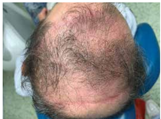
Obr. 9. Zachovaný vlasový kryt