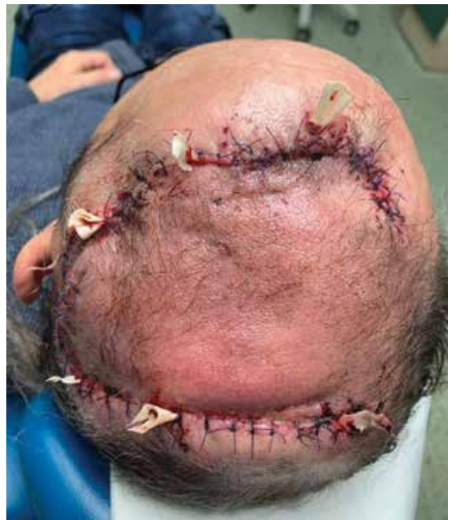
Obr. 8. Plastika defektu