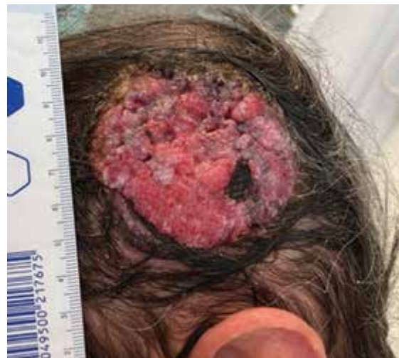
Obr. 1. Tumor parietotemporální oblasti

Při přípravě výkonu jsme z CT vyšetření lebky pacienta zhotovili počítačový 3D model oblasti (obr. 2)