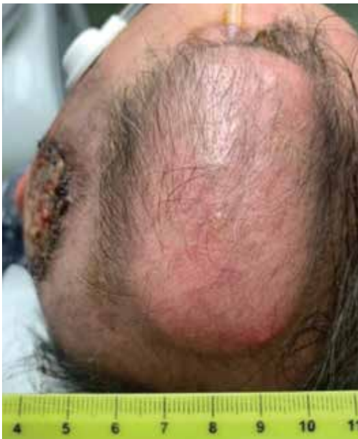
Obr. 6. Tkáňový expandér s portem zevně