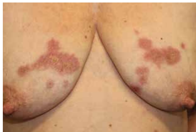
Obr. 2. Necrobiosis lipoidica na trupu

Diseminovaná perforující necrobiosis lipoidica je vzácnou formou rozsáhlejšího onemocnění spojená