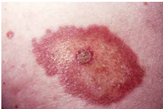
Obr. 1. Necrobiosis lipoidica s počínající ulcerací

Rodinný výskyt NL je vzácný. HLA asociace nebyla prokázána a nebyly prokázány rozdíly v HLA profitech diabetických pacientů s NL ve srovnání s profily diabetiků bez kožního postižení, průzkum se však týkal pouze diabetiků 1. typu [34]. Zajímavostí je případ jednovaječných dvojčat, žen, diabetiček 2. typu, u kterých se u obou vyvinula ložiska NL. U první ženy se kožní projevy objevily o pět let dříve než u druhé a jejich vznik předcházel onemocněním diabetem 2. typu, u druhé ženy byl naopak nejprve diagnostikován diabetes mellitus 2. typu a až po půl roce po stanovení této diagnózy se objevila kožní ložiska. Obě sestry měly ložiska NL lokalizovaná ventrálně na bérkách, histologické vyšetření dávalo obdobný výsledek, a v obou případech onemocnění nedostatečně reagovalo na lokální léčbu klobetasolem [37].