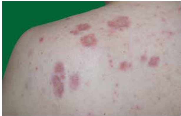
Obr. 2. Noduly v detailu

U pacienta byla proto zahájena kombinovaná systémová terapie prednisonem v dávce 20 mg denně a metotrexátem v dávce 10 mg 1krát týdně. Vzhledem k dobré terapeutické odezvě a pozvolné regresi plicního nálezu byla dávka prednisonu postupně snižována na současných 5 mg denně, dávka metotrexátu prozatím ponechána na 10 mg 1krát týdně. Pacient zůstává nadále v pravidelné pneumologické péči. Při poslední kontrole, 32 měsíců po zahájení léčby, byl pacient bez kožních projevů, plicní nález byl oboustranně s výraznou regresí postižení intersticia.