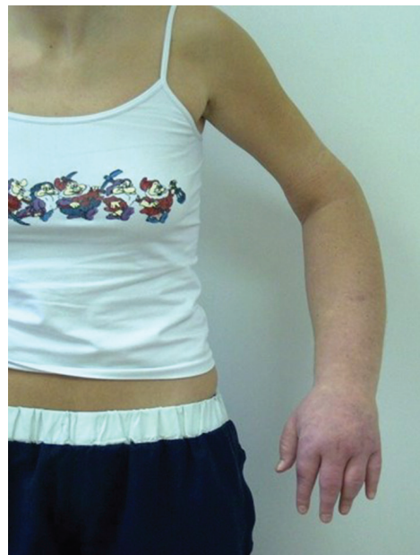
Obr. 4a). Otok levé horní končetiny způsobený jejím zaškrcením

Pacientka ve věku 27 let byla odeslána k hospitalizaci na kožní oddělení pro otoky levé dolní končetiny k vyloučení poruchy lymfatické drenáže. V předchozích dvou letech byla opakovaně hospitalizována pro ataky dušnosti, horeček a polymorfní potíže v mnoha nemocnicích po celém kraji. Udávala polyvalentní alergii, užívala čtyři druhy bronchodilancií, dále methylprednisolon, zolpidem (hypnotikum), mirtazapin, escitalopram (antidepresiva) a řadu dalších medikamentů zahrnujících různé doplňky stravy, vazodilatancia, analgetika. V minulosti bylo vysloveno podezření na Münchhausenův syndrom