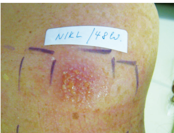
Obr. 8. Pozitivní reakce s mokráním a pustulami

Další časté reakce vznikající při epikutánních testech nepatří mezi alergické ani iritační reakce. Vyskytnout se