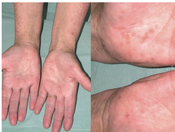
Obr. 8. Porokeratosis punctata palmaris et plantaris disseminata

V roce 1937 Andrew popsal novou klinickou variantu PK, provázenou mnohočetnými eflorescencemi lokalizovanými na trupu, genitálu, dlaních a na ploskách, kterou nazval DSP [5]. Tato forma PK je charakterizována drobnými červenými či hnědavými papulami s centrální atrofíi objevujícími se obvykle kolem 5.–10. roku věku, ale i později, prakticky kdekoli na těle a může být provázena svěděním (obr. 8) [95]. Léze se mohou vyskytovat i na sliznici dutiny ústní [83]. DSP se častěji vyskytuje u transplatanovaných, HIV pozitivních, či jinak imunosu-primovaných pacientů [87].