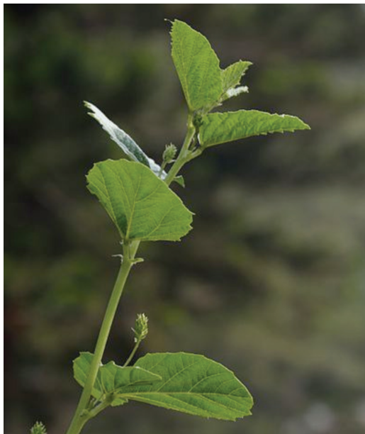
Obr. 6. Fabaceae (Psoralea corylifolia)