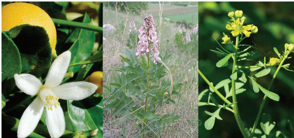
Obr. 3. Rutaceae (zleva: Citrus sinensis , Dictamnus albus , Ruta graveolens )

ní době. Ke zvýšení jejich obsahu může docházet vlivem stresu – napadení mikroorganismy, hmyzem, mechanickým poškozením, nevhodným klimatem a skladováním za nízkých teplot [7, 35, 49]. Jejich akční spektrum se nachází v rozmezí od 290 do 407 nm, s maximem nad 320 nm. Fotoreaktivita látek se mění podle substituce vodíkových atomů na molekule jednotlivých sloučenin methylovými, methoxylovými, hydroxylovými nebo dalšími radikály. Výraznější fototoxický efekt mají lineární psoraleny oproti angulárním. Nejsilnější fototoxický účinek pak má 5-methoxy-psoralen (5-MOP, bergapten) a 8-methoxypsoralen (8-MOP, xantotoxin) [29, 33, 35]. Polyacetyleny a deriváty thiofenu byly izolovány u čeledi Asteraceae (hvězdnicovité), ale fototoxické reakce nebyly publikačně zaznamenány, především asi proto, že tyto sloučeniny nebyly na kůži v dostatečně vysoké koncentraci či nepenetrovaly přes stratum corneum [8, 35]. Zástupci této čeledi jsou zejména zodpovědní za kontaktní alergické reakce prostřednictvím seskviterpenických laktonů [1, 33, 35].