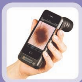
Ruční digitální dermatoskop