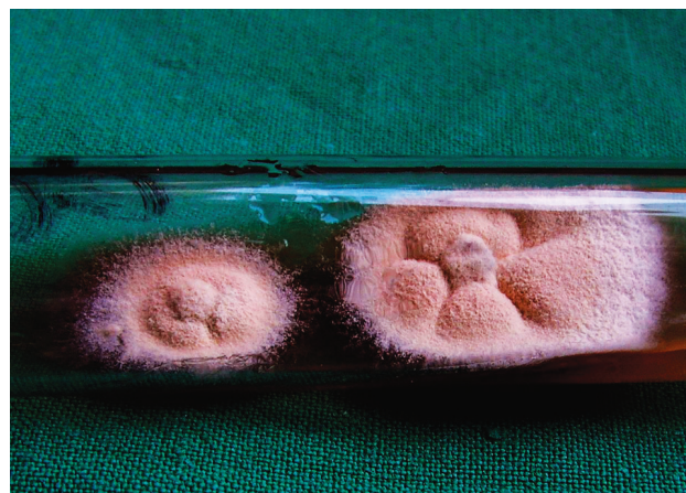
Obr. 3 a. Kultúra izolovaná zo šupín na ložisku – Trichophyton tonsurans

Ďalšími vyšetreniami sme zistili zvýšené markery zápalu FW 74/118, CRP 55,9 mg/l (norma do 10), Le 14,84 x 10 9 , znížené hodnoty Er: 3,61 x 10 12 , hemoglobínu 10,1 g/dl a hematokritu 30,2 %. Glukóza, hepatálne testy, úrea boli vo fyziologických hodnotách. Z hnisu sa kultiváciou zistili Staph. koaguláza negat. a Enterococcus faecalis. Boli stanovené diagnózy Tinea capitis profunda, Lymphadenitis occipitalis et colli a hypochromná anémia. Dieťa bolo liečené terbinafinom 125 mg p. o. denne 4 týždne, axetilcefuroximom 125 mg/5 ml v sirupe p. o. každých 12 hodín 10 dní, lokálne obklady KMnO 4 , mechanické odstránenie vlasov, Saloxyl ung., sol. iodi spirit. 5%, sírodecht 8% ung. Teplota ustúpila na štvrtý deň, bolestivosť, hnisanie, zápal aj infiltráty počas 2 týždňov. Markery zápalu pri kontrole o 11 dni boli vo fyziologických hodnotách.