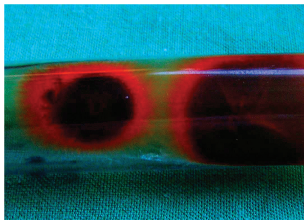
Obr. 3 b. Spodná strana izolovanej kultúry – Trihophyton tonsurans