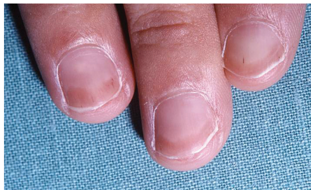
Obr. 7. „Half-and-half nail“ a třískovité hemoragie u pacienta s chronickou renální insuficiencí léčeného hemodialýzou