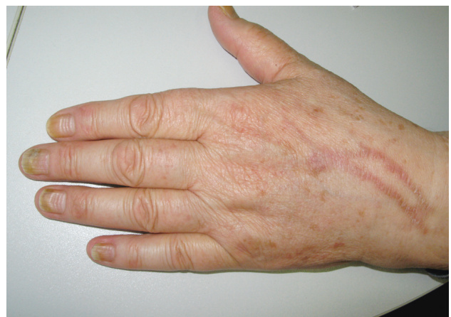
Obr. 5. Série Beauových linií po opakovaných cyklech i. v. chemoterapie. Na hřbetě ruky postflebitické hyperpigmentace po infuzích.

Při chemoterapii aplikované v krátkých, intenzivních pulzech dochází k tvorbě Beauových linií (obr. 5) až k onychomadésis. Může se také objevit výrazná transverzální leukonychie, zejména po cyklofosfamidu, adriamycinu a vinkristinu [9, 24]. Vedle pravé leukonychie, vyznačující se světlivě bílou barvou, se často objevuje i pseudoleukonychie – mléčné zakalení nehtových plotének. Může se projevit jako příčné Muehrckeho linie (viz obr. 4) nebo jako tzv. half-and-half nail, který je jinak popisován u renální insuficience (viz obr. 5). Pravá leukonychie je odrazem poruchy keratinizace přímo v nehtové matrix;