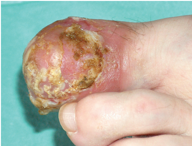
Obr. 4. Pustulózní psoriáza s destrukcí nehtu po terbinafinu. Pacientka měla původně minimální psoriatická ložiska na predilekčních místech.

což prokázaly histologické studie. Pigmentace se zpravidla objevuje po 8 týdnech léčby a mizí po vysazení léku [16, 19, 31]. Glaser [17] však uvádí čtyři případy pacientů s HIV, u kterých se modravá nehtová dyschromie vyskytla bez asociace s azidothymidinem.