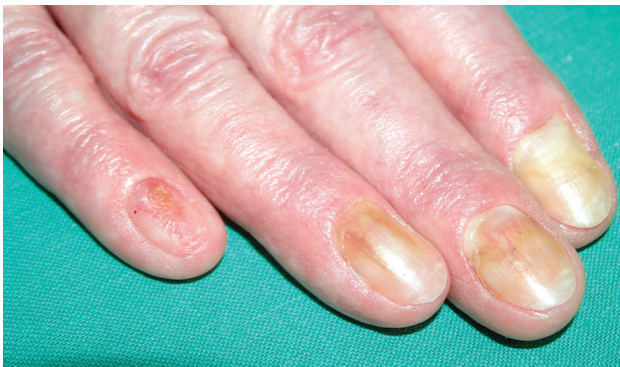
Obr. 1. Onycholysis a onychomadesis (na 5. prstu) při Lyellově syndromu po piroxikamu

Onychomadesis je spontánní odloučení nehtu v oblasti matrix, kdy odpadá celá nehtová ploténka (obr. 1).