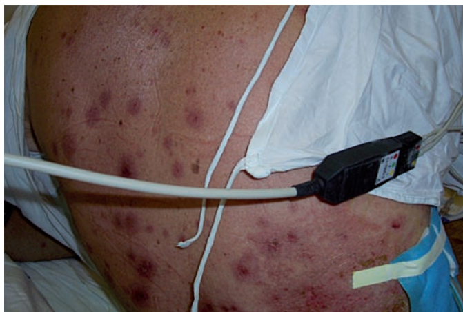
Obr. 3. Klinický obraz – kazuistika 1