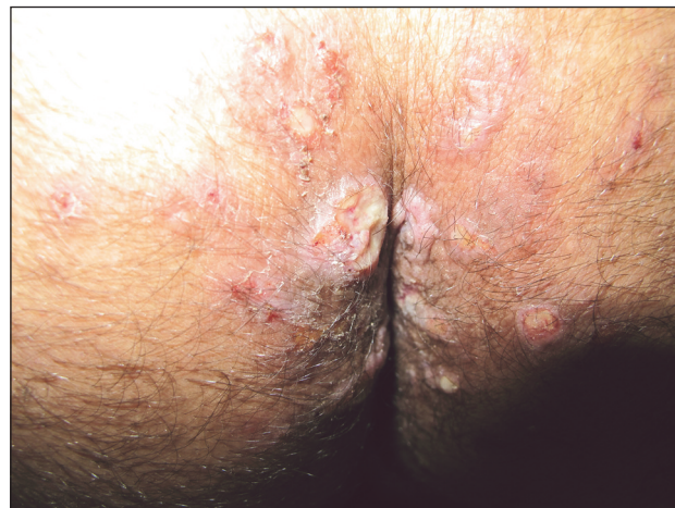
Obr. 3. Condylomata lata u HIV pozitivního pacienta

stádia mohou vykazovat nodulo-ulcerativní charakteristiky. Z klinických symptomů vedle klasických projevů (obr. 3 – Condylomata lata u HIV pozitivního pacienta) byla popsána palmoplantární keratodermie jako projev sekundární syfilis [66]. Častěji bývají popisovány i oční a ušní manifestace syfilis u HIV pozitivních pacientů [68]. Postižení CNS se může objevit podstatně dříve , a to dokonce u primární syfilis [6]. Doporučovaná terapeutická schémata nemusí být dostatečná v terapii a v prevenci CNS postižení: Poukazuje se i na možnost časných relapsů CNS postižení i po standardní terapii, pravděpodobně díky kombinaci alterované buněčné imunitní odpovědi při HIV infekci a nedostatečným hladinám účinného léčiva v CNS [6]. Jarisch-Herxheimerova reakce při terapii syfilis bývá častější. Před započítím terapie neurosyfilitické infekce musí být řádně vyšetřen mozkomíšní mok u všech HIV pozitivních osob s latentní syfilis delší než 1 rok nebo neznámé délky trvání.