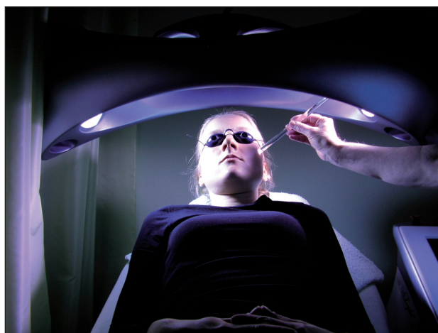
Obr. 2. Prístroj emitujúci intenzívne modré svetlo. Výrobca k prístroju dodáva dištančnú tyčinku na rýchle a jednoduché nastavenie správnej vzdialenosti ošetrovanej kože od zdroja svetla. Intenzita svetla sa znižuje so štvorcom vzdialenosti, preto je dodržanie predpísanej vzdialenosti nevyhnutným predpokladom úspechu.

zlepšenie u pacientov s akné a seborrheou po 10 ošetreniach (4krát týždenne) vysokotlakovou výbojkou vyžarujúcou modré svetlo (400–420 nm) s výkonom 55 mW/cm 2 , pri kumulatívnej dávke 325 J/cm 2 (19). Kawada et al. použili v liečbe 30 pacientov prístroj Clearlight (Lumenis, Santa Clara, USA), ktorý má emisné spektrum 407–420 nm a výkon 90 mW/cm 2 (obr. 2). Autori pozorovali 55% úbytok lézií asociovaných s akné po 5 týždňoch (2 ošetrenia za týždeň) (14). Tzung et al. skúmali účinnosť liečby akné u 31 pacientov pri použití prístroja F-36 W/Blue V (Waldmann, Nemecko). Pri každom ošetrení aplikovali dávku 40 J/cm 2 . Pacienti boli ožiarení 2krát za týždeň počas 4 týždňov. Po skončení ôsmeho ošetrenia bol zaznamenaný 52-% pokles počtu prejavov akné (28). Práca dokazujúca účinnosť LED ako zdroja svetla pre liečbu akné bola publikovaná Tremblayom et al. Použili prístroj Omnilux Blue (Photo Therapeutics, Inc., Lake Forest, USA) a nezaznamenali vedľajšie účinky (27).