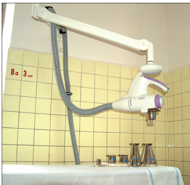
Obr. 4. Nový přístroj pro terapii Buckyho paprsky.

vycházejí, je tzv. Lindermannovo okénko. Je vyrobené z křehkého skla, v němž křemičitany jsou nahrazeny boráty, a sodík, draslík a vápník lithiem a beryliem. I toto sklo pohlcuje ještě asi 50 % vznikajícího záření, jež je délky mezi 1 Å a 3 Å (1 Å = 1 \cdot 10^{-10} m = 0,1 \cdot 10^{-9} m = 0,1 nm). Paprsky větší vlnové délky se rychleji pohlcují ve vzduchu. Proto se také v praxi přesně měří vzdálenost ohniska od kůže. Paprsky 2 Å se pohlcují v 10 cm vrstvě vzduchu z 20 %, paprsky 3 Å ze 40 %. Absorpce v kůži je ovšem daleko vyšší. Záření 3 Å ztrácí polovinu své intenzity v 0,2 mm, záření 2 Å v 1 mm hloubky kůže. Protože většina paprsků je průměrné délky 2 Å, pohlcuje se většina záření v epidermis a v horním kóriu. Záleží to na tloušťce kůže, lokalizaci a druhu onemocnění. Terapeutické dávky takřka nezasáhnou hlubší kórium a subcutis. Proto se při něm nevyskytují hluboké, bolestivé RTG ulcerace. Z těchto poznatků vychází i terapie tímto zářením v případě odpovídajících diagnóz (obr. 3 a 4).