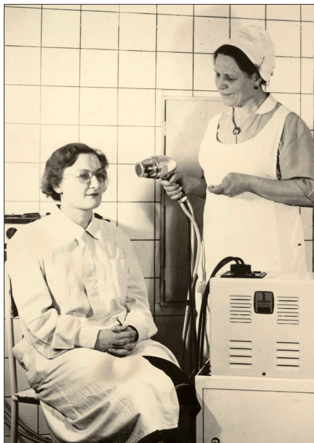
Obr. 2 Ukázka užívání Chaoulovy lampy.

Buckyho lampa (Gustav Bucky – německý rentgenolog). Ještě nižší napětí se užívá u Buckyho lampy, která vydává tzv. hraniční paprsky; „hraniční“ proto, že jejich vlnová délka je poměrně velmi dlouhá, na hranici mezi ultrafialovým zářením a X-paprsky. Tyto paprsky by se normálním sklem skoro úplně pohltily. Na místě, kde z lampy