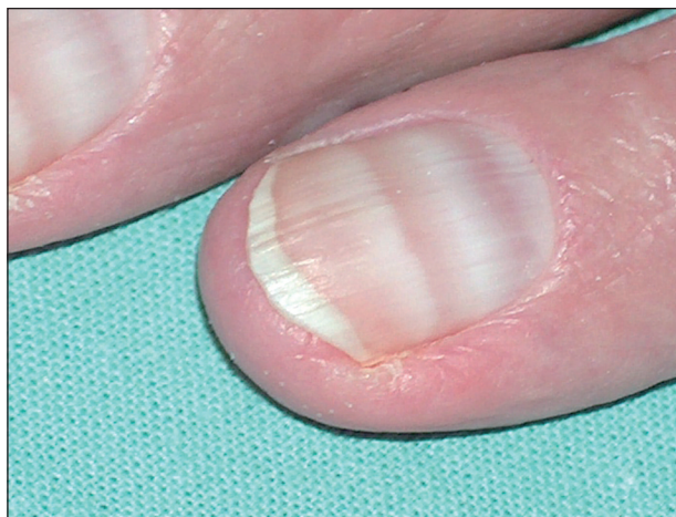
Obr. 10. Meeovy linie na nehtech po imatinibu.

Klinické zkušenosti s léčením dalšími inhibitory jsou zatím omezené, kožní reakce se uvádějí u dasatinibu . Dasatinib vyvolává erytémy, exantémy a „exfoliativní der-