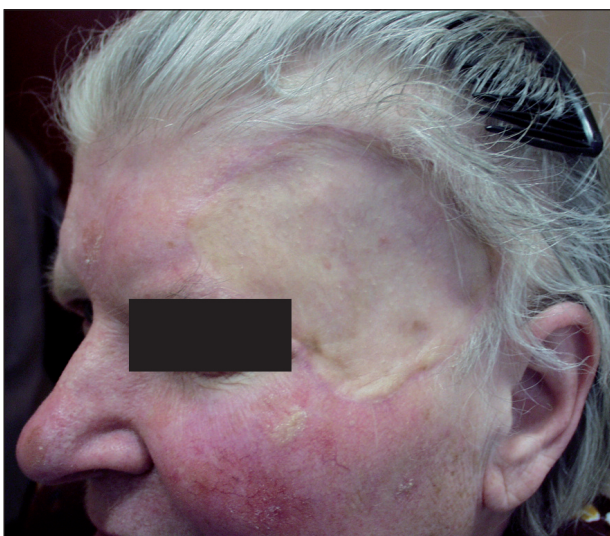
Obr. 3. „Záplata“ po přihojení transplantátu plné kůže.

Kožní transplantát (7) přichází při uzávěru rány v úvahu obvykle až jako poslední možnost, když primární sutura, místní lalok ani ponechání rány ke spontánnímu hojení nejsou vhodné nebo možné. Transplantát je zvažován většinou jako poslední možnost zejména z kosmetických důvodů, neboť obvykle zanechává nápadnou „záplatu“, zvláště pokud odebraná kůže je výrazně odlišná od kůže v místě aplikace (obr.3). Nevýhodou metody je i vznik druhé rány v místě odběru transplantátu, kterou je nutno uzavřít nebo jinak ošetřit. Přesto má použití transplantátu i své nesporné výhody. Provedení je technicky jednodušší než u většiny místních laloků a lze jím spolehlivě kryt téměř každou ránu, která má dostatečně vaskularizovanou spodinu. Výběr dárcovských míst je dosti širo-