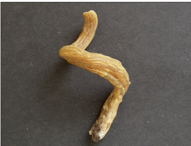
Obr. 2. Gigantický kožní roh po snesení.