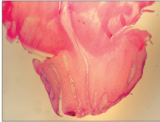
Obr. 3. Gigantický kožní roh, histologický nález, hematoxylin/eozin, 40x.