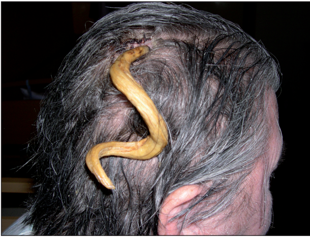
Obr. 1. Gigantický kožní roh ve kštici.