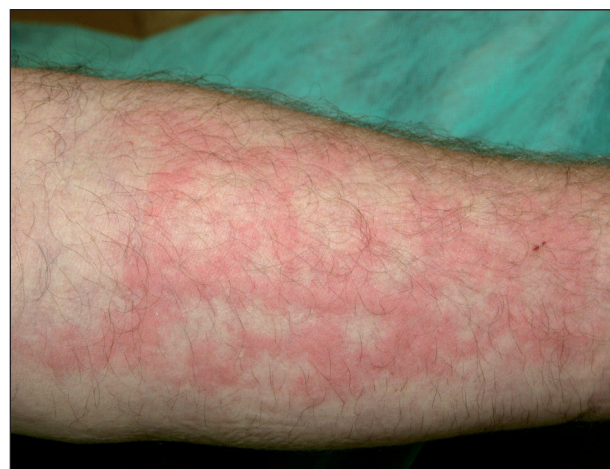
Obr. 13. Chladová kopřivka.

Solární kopřivka se objevuje několik minut po vystavení kůže slunci nebo umělým světelným zdrojům. Ustupuje většinou do hodiny po ukončení expozice (4, 24, 28, 30). Počátečním příznakem je svědění, následované erytémem a urtikariálním výsevem. Častěji než na opakovaně exponovaných oblastech (obličej, ruce) dochází k výsevu na místech méně často vystavených záření (trup). V léčbě první linie jsou doporučována antihistaminika, jako druhá linie pak desenzitizační fototerapie, případně PUVA (5). Pokud akční spektrum leží v UV oblasti, je prevencí účinná fotoprotekce, a to externy nebo