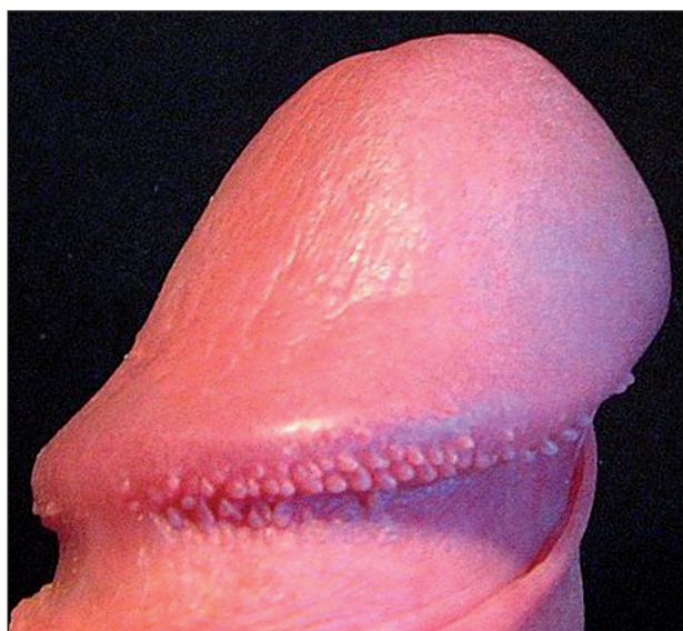
Obr. 2 Papillae coronae glandis.

zy u novorozenců dokonce i u orangutanů (4). Anglický termín „pearly penile papules“ byl zaveden, aby mylně nezavdával dojem vztahu k vlasovému folikulu (6). V současné době jsou PCG považovány za fylogenetická rezidua s histologickým obrazem akrálních angiofibromů.