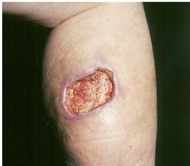
Obr. 3. Ulcus cruris arteficialis.

Arteficiální ulcerace se vyskytují na kterémkoliv místě těla, dolní končetiny nevyjímaje. Poškozující příčinou jsou látky chemické, které kůži poleptají, nebo účinky fyzikální, nejčastěji vysoké teploty (např. popálení cigaretou). Nápadným znakem takto navozených bérceových vředů je zdravé a nepostižené okolí (obr. 3).