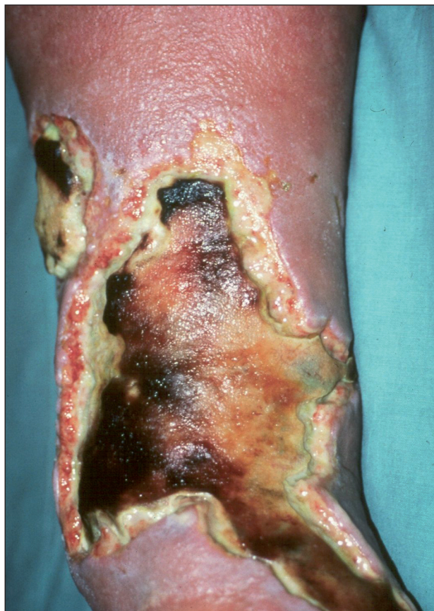
Obr. 2. Ulcer cruris post erysipelam.

K chemickým příčinám, které mohou výrazně poškodit kůži až vzniknou ulcerace, patří kyseliny, louhy, umělá hnojiva, rostlinné extrakty, dezinfekční prostředky a léky. V místě kontaktu s chemikálií nastupuje po předcházejícím zánětu nekróza, podle charakteru chemikálie kolikvační nebo koagulační. Kolikvační nekrózu způsobují koncentrované alkálie. Příškvary vzniklé jejich poleptáním jsou měkké, vzniklé ulcerace s neostře ohraničenými okraji. Naopak kyseliny způsobují koagulační nekrózu a vytvářejí příškvary tuhé, ostře ohraničené.