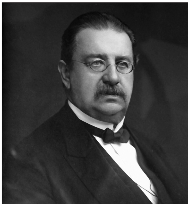
Obr. 1. Prof. Vítězslav Janovský.

nemocí a vedle toho suploval od roku 1874 na I. chirurgické klinice za profesora Blažinu. Byl tedy vytížen vedením více pracovišť a sotva se tak mohl věnovat vědecké práci. Existuje ale také domněnka, podle které Weiss vedl kožní oddělení s úmyslem, že je předá ve vhodné době některému schopnému českému lékaři, kterého nakonec viděl ve Vítězslavu Janovském.