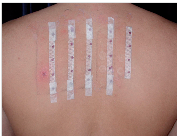
Obr. 4. Pozitivní epikutánní test na PPD a benzokain u pacienta č. 1.

vyšetřena v květnu 2004. Na počátku května si nechala na dovolené v zahraničí provést na bérce tetováž henu. Sedmý den se objevily v místě tetováže vezikuly na výrazném zánětlivém a edematózním podkladě (obr. 5, 6). Lokální nálezy se stále zhoršoval a byl provázen silným pruritem. Byla léčena 12 dní za hospitalizace lokálními kortikosteroidy s elastickou bandáží, ale i kortikosteroidy celkovými v dávce 200 mg hydrokortisonu denně po dobu 4 dní a antihistaminiky. Byla propuštěna zhojena. V únoru 2005 byly provedeny epikutánní testy rutinní sadou Trolab Hermal a byla prokázána kontaktní přecitlivělost na PPD na +++ (obr. 7). Testy byly odečítány po 24–48 a 72 hodinách. Primární senzibilizace vznikla nejspíše po barvení vlasů tmavou barvou v minulosti, aniž došlo ke vzniku kontaktního ekzému.