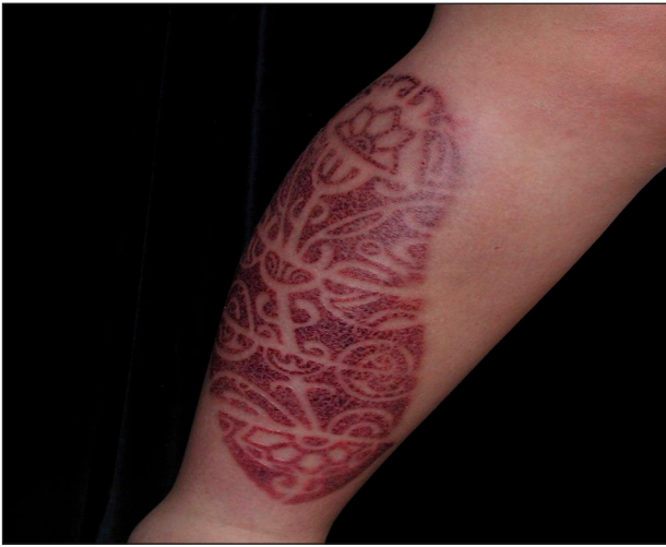
Obr. 5. Kontaktní ekzém na bérce u pacienta č. 2.