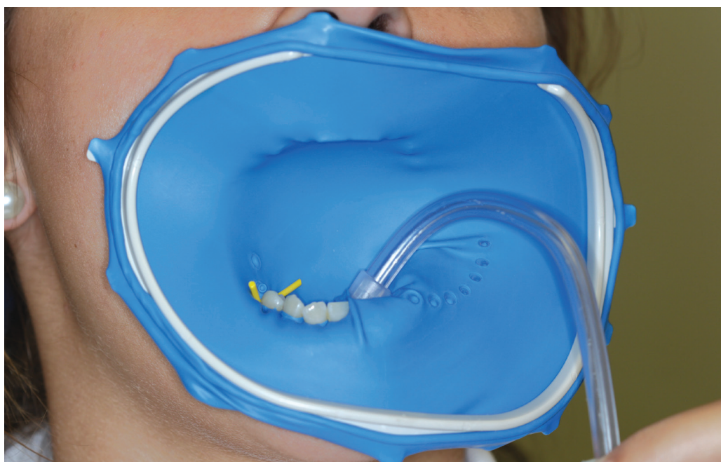
Obr. 2 OptiDam