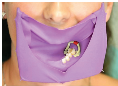
Obr. 1 Kofferdam aplikovaný do dutiny ústní

Další systémy zajišťující absolutní izolaci operačního pole jsou například OptiDam (Kerr Hawe SA, Švýcarsko) a OptraDam plus (Ivoclar Vivadent, Lichtenštejnsko). OptiDam využívá plastový rámeček modifikovaný podle tvaru obličeje pacienta ( obr. 2 ). OptraDam plus se skládá z gumové blány s vyznačenými mís-