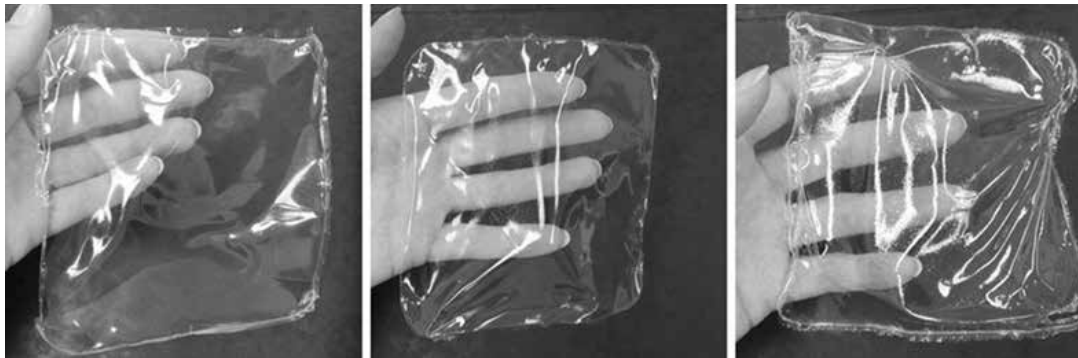
Obr. 2. Vzhled filmů 2-5G-PL (vlevo), 2-10G-PL (uprostřed) a 2-15G-PL (vpravo)