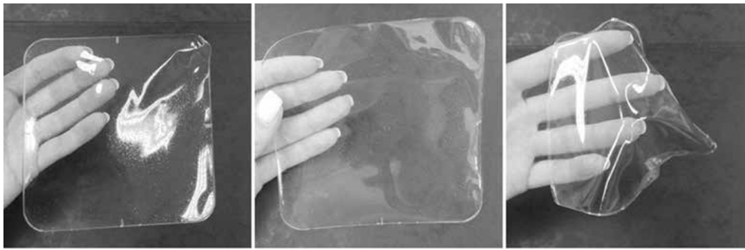
Obr. 1. Vzhled filmů 2-5G (vlevo), 2-10G (uprostřed) a 2-15G (vpravo)