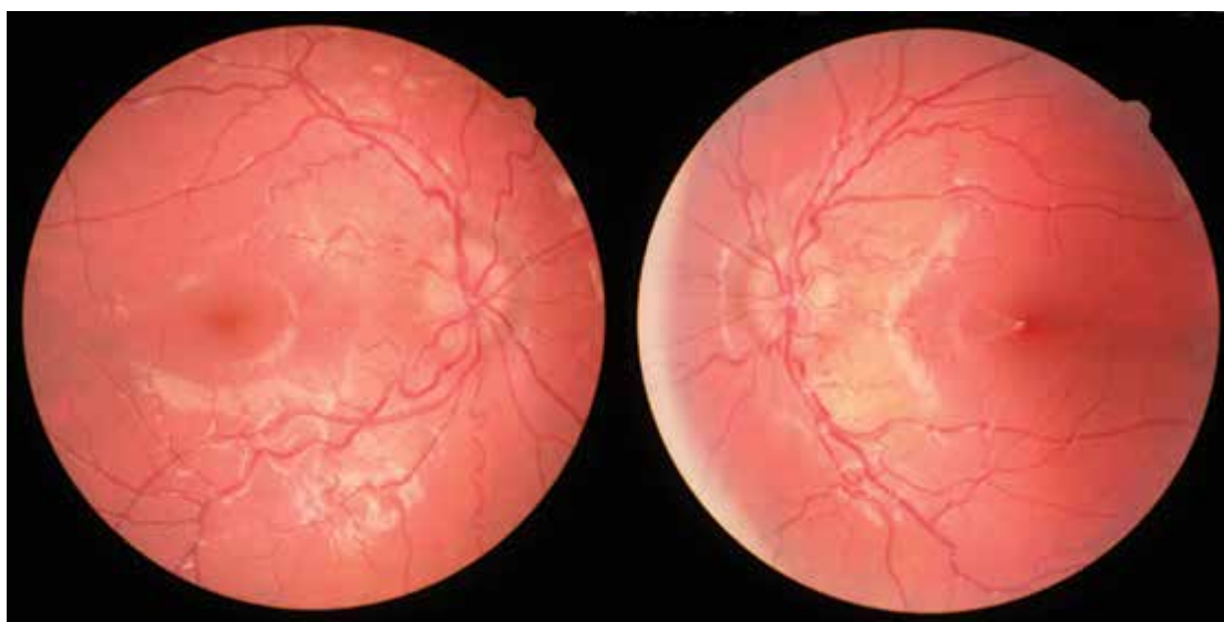
Obrázek 1. Fotografie očního pozadí pacienta (červenec 2015)

Invazivní vyšetření typu fluorescenční angiografie v tuto dobu nebyla indikována. Kontrolní MR proběhla v červnu 2013 s normální nálezem na mozku. Poté oční kontroly probíhaly každých 6 měsíců, nález byl stále stejný a pacient bez potíží. Kontrolní vyšetření ve Všeobecné fakultní nemocnici v Praze bylo realizováno v červenci 2015. Vidění obou očí bylo 1,0, nitrooční tlak normální. Na předním segmentu popsán normální nález, mikroexoúchylka byla bezpečně v mezích fúze, dále izokorie s normálními reakcemi zornic, na očním pozadí papily prominovaly, bez hemoragií, cévy byly vinutější, ale bez větší náplně žilní, jen plnější kapilární síť. Dle ultrazvuku nebylo vpravo možné vyloučit drobnou drúzu terče zrakového nervu, vlevo drúzy zachyceny nebyly. Drúzy nebyly nalezeny ani autofluorescencí na OCT. Na perimetru popsáno normální zorné pole bilaterálně, sice s nižší spolehlivostí, ale slepé skvrny nebyly zvětšeny. Závěr: „Oční nález je sice za