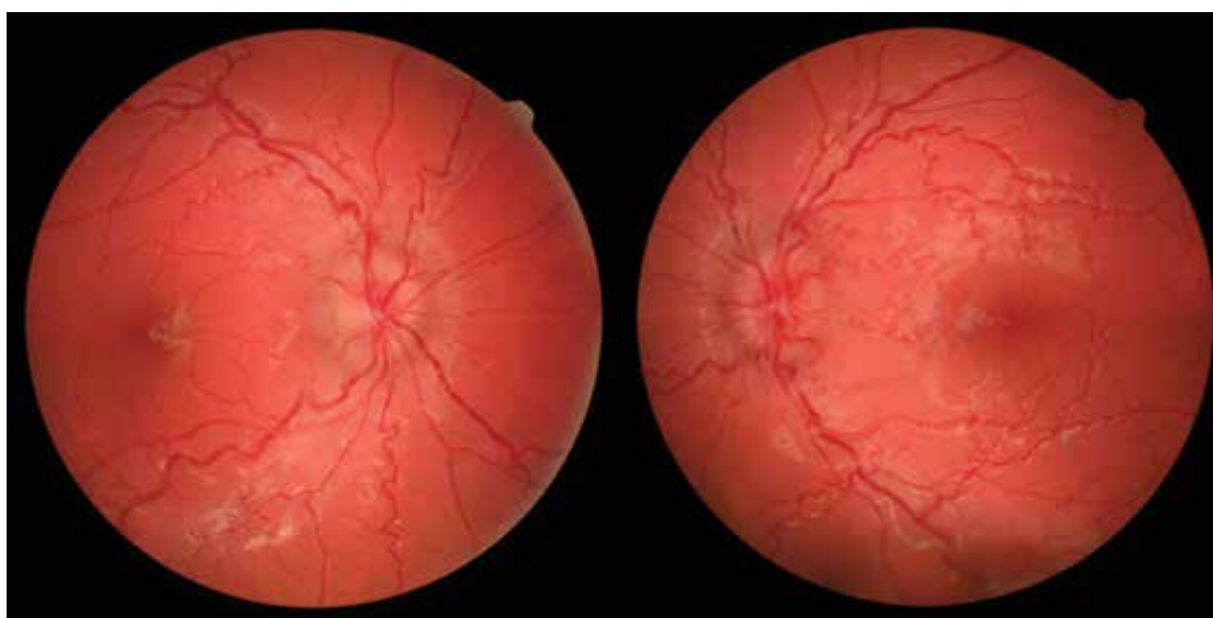
Obrázek 2. Fotografie očního pozadí pacienta (srpen 2020)