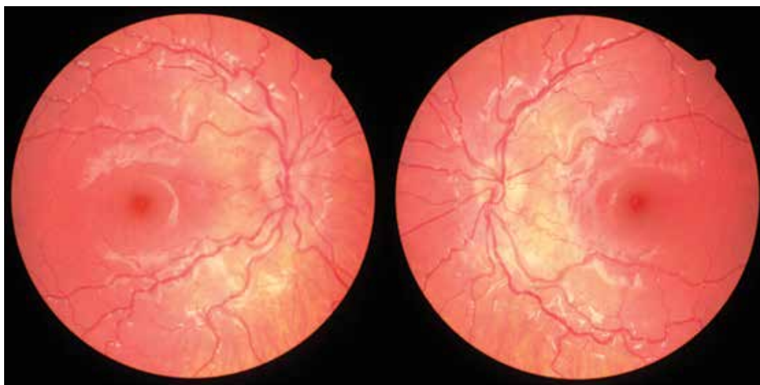
Obrázek 4. Fotografie očního pozadí sestry pacienta (2017)