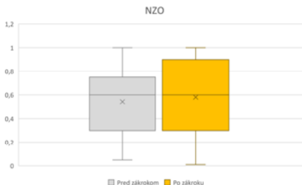
Graf 1. Zmena NZO pred operáciou a po operácii NZO – nekorigovaná zraková ostrosť

Výsledky vykazujú zmenu NZO 0,54 (Snellen) (0,267 logMAR) ±0,31 pred zárokom a 0,58 (Snellen) (0,235 logMAR) ±0,34 po zároku bez štatistickej významnosti (p = 0,371) (Graf 1) a NKZO 0,87 (Snellen) (0,06 logMAR) ±0,17 pred zárokom a 0,89 (Snellen) (0,05 logMAR) ±0,18 po zároku taktiež bez štatistickej významnosti (p = 0,938) (Graf 2). Taktiež boli pozorované zmeny zakrivenia prednej plochy rohovky – AIC S (pred 45,95 Dpt ±1,51 po 45,67 Dpt ±1,43), AIC F (pred 43,81 ±1,47, po 43,48 Dpt ±1,53) a AIC M (pred 44,89 Dpt ±1,4, po 44,57 Dpt ±1,35), ktoré vykázali štatisticky významnú zmenu v zmysle zníženia (p = 0,019; p = 0,010 a p = 0,005). Zmeny zakrivenia zadnej plochy rohovky PIC S (pred 6,99 Dpt ±0,58, po 7,04 Dpt ±0,54), PIC F (pred 6,26 Dpt ±0,35, po 6,27 Dpt ±0,33), a PIC M (pred 6,59 Dpt ±0,46, po 6,62 Dpt ±0,4) boli štatisticky nevýznamné