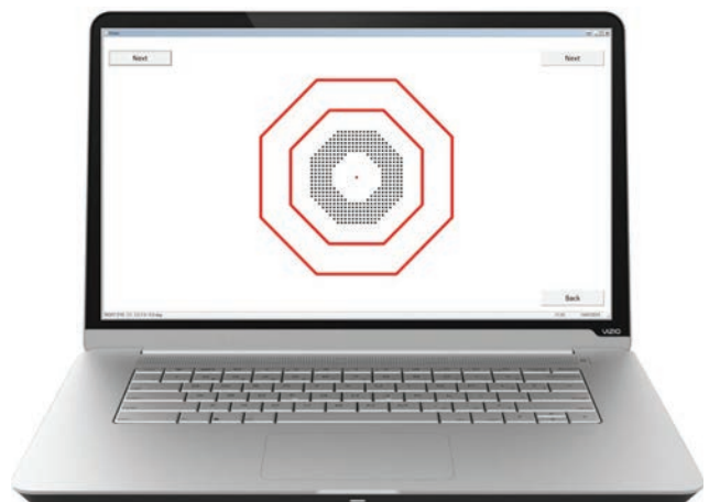
Obrázek 1. Testové rozhraní při testování metamorfopsií v programu D Chart

Kvantifikace metamorfopsie tedy může pomoci zhodnotit zlepšení zrakových funkcí pacienta a pomoci vybrat vhodného pacienta pro operaci. To vedlo autory k vývoji testu nazvaného D Chart, který je možné použít před operací i po operaci u pacientů s nízkou zrakovou ostrostí pro kvantitativní zhodnocení jejich metamorfopsie [7]. V původním provedení byl test v podobě papírových kartiček. Na kartičkách byly vytištěné prstence tvořené malými testovými čtverci kolem centrální fixační značky. Prstence měly různý poloměr. Vzdálenost jednotlivých čtverců rozmístěných do pravidelné mřížky byla od 0,4^\circ do 1,8^\circ . Pacient měl za úkol v každém z celkem osmi sektorů prstence označit místo, kde se mu mřížka zdála pokřivená. Suma maximální vzdálenosti mezi čtverci z každého sektoru a pro každou velikost prstence, při které viděl pacient mřížku ještě pokřivenou, tvoří celkové skóre metamorfopsie (M-skóre). V pilotní studii [7] byl prokázán pokles mediánu celkového M-skóre u pacientů před operací a po operaci