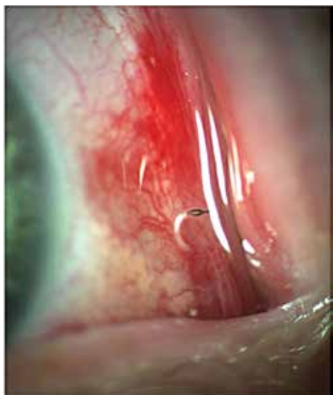
Obrázek 2. Velmi rychle se pohybující živí jedinci se dají obtížně fotošterbinou zachytit

a rohovky. Nejčastěji se projevuje jako akutní katarální konjunktivitida s nespecifickými příznaky pocitu cizího tělesa, slzení, fotofobie, erytém a event. periokulární edém. Projevy jsou obvykle krátkodobé a samolimitující, protože larvy se nemohou dále vyvíjet a umírají do 10 dnů. 2. vnitřní ophthalmomyiáza, kdy larvy pronikají do oční bulvy, jsou patrné v komorové vodě, v duhovkovém, sklivcovém nebo subretinálním prostoru, vzácně může způsobit zrak ohrožující endoftalmitidu a optickou atrofii. 3. orbitální ophthalmomyiáza: larvy pronikají do orbity a postihují adnexa a zrakový nerv [3]. Larvy Oestrus ovis však nejsou schopny vylučovat proteolytické enzymy, proto jsou většinou omezeny na vnější povrch oka [4]. V literatuře jsou uváděny vzácné případy komplikací jako jsou: podspojivkové krvácení (Obrázek 2), vřed rohovky, zhoršený zrak, intraokulární invaze s endoftalmitidou, iridocyklitida a dokonce slepota [5].