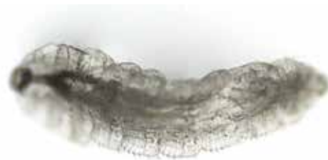
Obrázek 4. Larva Oestrus ovis (zvětšení 100x, Nikon Eclipse)