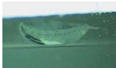
Obrázek 3. Uložený jedinec larvy Oestrus ovis ve Formolu focený na šterbinové lampě

Popisujeme případ očního onemocnění u muže středního věku z Čech, jenž trávil letní dovolenou sedm týdnů před vyšetřením na severu Řecka. V pozdních večerních hodinách v posledním srpnovém týdnu roku 2019 navštívil pacient oční pohotovostní službu. Údajně mu do levého oka vletly piliny, oko slzelo a bolelo. Kromě drobné eroze epitelu rohovky a lehce překrvené spojivky se zvláště ve vnitřním koutku a při podrobnějším vyšetření po celém povrchu bulbární spojivky i ve fornixech rychle pohybovalo v slzném filmu vlnivým pohybem přes dvacet podlouhlých 1,5–2 mm velikých světlých mikroorganismů s tmavým rostrálním koncem (oči a orgány)