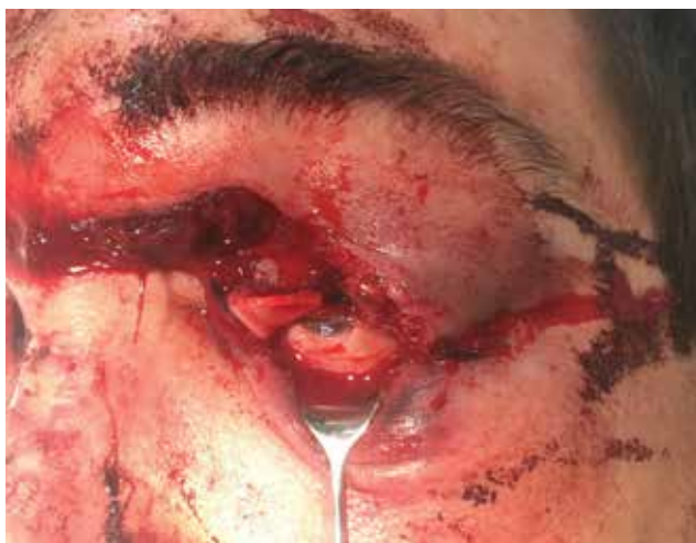
Obrázek 5-a. Profesionální poranění pilou. Rána na horním víčku je natolik hluboká, že došlo k poškození musculus levator palpebrae superioris

V případě orbitálního poranění pak vždy doplňujeme zobrazovací metodu, primárně CT [19]. CT vyšetření nám navíc může pomoci při nepřehledném nálezu vyloučit poranění očního bulbu – jeho sensitivita je v tomto případě kolem 75 % [20]. Navíc má nezastupitelnou úlohu při identifikaci cizího tělesa v očníci. Jedině pokud je definitivně cizí kovové těleso očníce či bulbu vyloučeno, můžeme přistoupit k vyšetření magnetickou rezonancí (MR). MR je užitečná při detekci některých organických cizích těles, či pro lepší přehlednutí formovaného hematomu