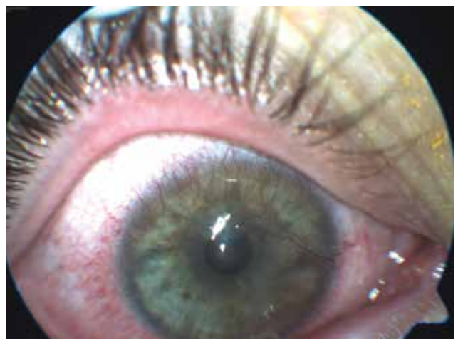
Obrázek 2. Pravé oko u pacientky z kazuistiky 1, viditelná smíšená vaskularizace rohovky