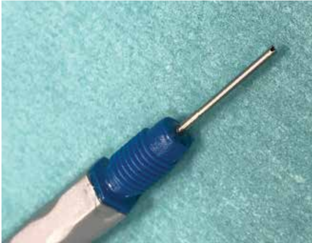
Obrázok 2. Detail koncovky Nanosekundového lasera

mentáciou šošovkových hmôt za pomoci irigácie a aspirácie.