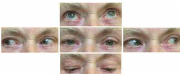
Obrázek 2. Úprava oftalmoplegie

Následná operace katarakty (v říjnu 2015 vpravo a březnu 2016 vlevo, s implantací zadněkomorové nitrooční čočky zlepšila nejlepší korigovanou zrakovou ostrost pravého oka z 0,5 na 1,0 a levého oka z 0,5 na 0,8 (Obrázek 1) – pseudophakie nativně a v arteficiální mydriáze). Nitrooční tlak je fyziologický bez nutnosti léčby. Celková i lokální léčba vedla k normalizaci neurologického a úpravě očního nálezu (Obrázek 2) – fyziologická motilita očí. Sledovací doba jsou tři roky.