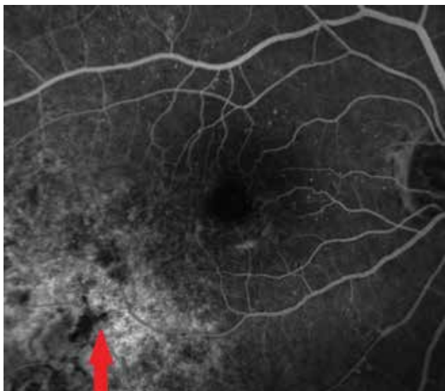
Obrázek 3. Fluoresceínová angiografia nádorového ložiska o 4 roky neskôr v r. 2017

reotaktickú rádiokirurgiu na lineárnom urýchľovači LINAC na Onkologickom ústave Sv. Alžbety v Bratislave v spolupráci s Klinikou Oftalmológie LF UK a UNB Ružinov v rokoch 2007-2016. Dávka ožiarenia na oblasť tumoru bola od 35,0 do 62,06 Gy, medián 40,13 Gy. Postradiačná makulopatia bola diagnostikovaná na základe nálezu na optickej koherentnej tomografii. Dáta boli retrospektívne vyhodnotené v januári 2018, teda sledovacie obdobie bolo 13-122 mesiacov.