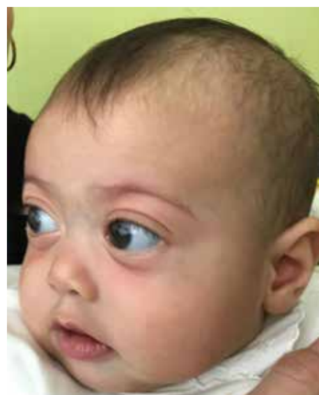
Obr. 2: Dysmorfia strednej časti tváre, plytké orbity, pseudoexoftalmus, hypertelorizmus a nízky koreň nosa u pacientky s Marshall/Sticklerovým syndrómom vo veku 4 mesiacov.