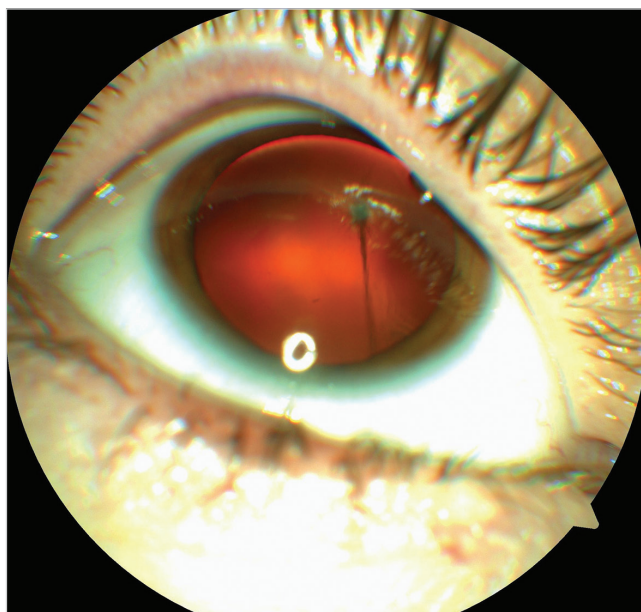
Obr. 3 Barevný fotografický snímek předního segmentu pravého oka: perzistující arteria hyaloidea upínající se k zadní části pouzdra nitrooční čočky

Druhá kazuistika: Pacientka, 35letá žena, přichází na naši kliniku ke konzultaci stran operačního řešení stavu sítnice OL, které bylo doporučeno na jiném pracovišti. Vstupně udává asi rok trvající zhoršování vidění na OL, kdy nejvíce obtěžuje únava při práci a pocit tlaku v OL. Anamnesticky se pacientka dlouhodobě s ničím neléčí, pravidelně žádné léky neužívá. Kompletní oční vyšetření podstoupila naposledy asi před deseti lety, brýlovou korekci nenosí, ale udává provedení laserového ošetření sítnice OL před 15 lety. NZO OP byla 0,8, korekce nelepšila a NZO OL 0,12, s korekcí +2,0sf / -1,0cyl / 100° 0,6 paracentrálně, NOT měřený bezkontaktně v normě, vpravo 19 torrů a vlevo 16 torrů.