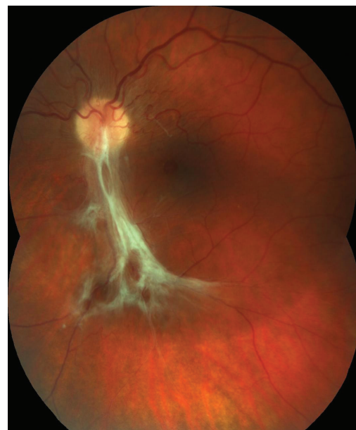
Obr. 5 Barevný fotografický snímek fundu levého oka: preretinální fibróza při dolní temporální arkádě způsobující nařazení sítnice v centrální krajině

Vyšetření předního segmentu na štěrbinové lampě odhalilo PAH OP s úponem distálního úseku k zadnímu pouzdru čočky (obr. 3), dále nález na OP i OL fyziologický. Fundoskopie v mydriáze OP ukázala proximální část PAH Inoucí k horní temporální arkádě, kde podmínila vznik lokálního TOS star-