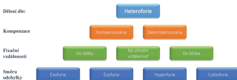
Obr. 1 Klasifikace heteroforií dle způsobu kompenzace, fixační vzdálenosti a směru odchylky (Evans, 2007)

Při posouzení akomodačních funkcí je rutinně ověřována zraková ostrost do blízka a dostupná amplituda akomodace (AA). Adekvátní hodnota AA však neeliminuje možnost poruchy akomodace [23]. V takovém případě může existovat problém s únavou akomodace (Ill-sustained akomodace), se snadností akomodace (infacilita akomodace) anebo neschopností relaxace akomodace. V případě potíží charakteristických pro akomodační poruchy je třeba komplexnější hodnocení akomodačního systému dalšími testy.