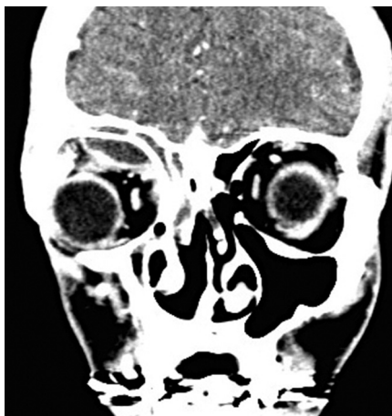
Obr. 4 Subperiostálny absces vpravo – axiálna projekcia.

diacej s prínosovými dutinami (obr. 3, 4). III. orbitálny absces – heterogénna denzita v oblasti orbitálneho tuku (5).