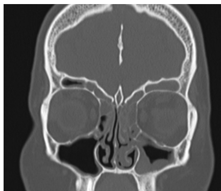
Obr. 1 Fronto-etmoido-maxilárna polysinuitída vľavo.

Najčastejším zdrojom orbitálnej komplikácie, podobne ako v iných súborech (16), bola etmoidálna sinusitída (62,5 %). Lamina papyracea oddelujúca orbitu od etmoidálnych dutín predstavuje slabú bariéru v šírení zápalu, čo môže byť ešte uľahčené aj dehiscenciami tejto tenkej kostenej lamely. Izolovaná maxilárna sinusitída je menej častou (25 %) príčinou orbitálnej komplikácie. V klinickom obraze sa najskôr vyvíja edém dolného viečka a až následne aj horného viečka. Ak je príčinou vzniku subperiostálneho orbitálneho abscesu maxilárna sinusitída, absces je situovaný na spodine orbity a spôsobuje dislokáciu očného bulbu nahor. Netreba zabúdať, že izolovaná maxilárna sinusitída je často dentogénneho pôvodu, kde vedľa aeróbnej bakteriálnej flóry je prítomná aj anaeróbna. Frontálna sinusitída je najmenej častou príčinou orbitálnych komplikácií (12,5 %). Nebezpečenstvo